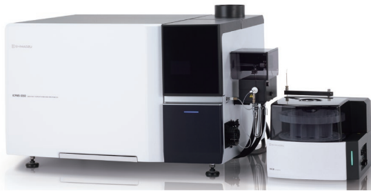
图 1 ICPMS-2050 和 AS-20