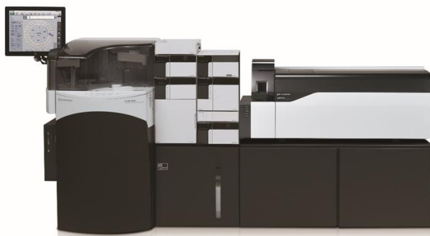
图 1. 岛津 CLAM-2000 和 LCMS-8050 联用系统

本实验使用岛津全自动在线前处理系统 CLAM-2000、超高效液相色谱仪 LC-30A 和三重四极杆质谱仪 LCMS-8050 联用系统。具体配置为：在线自动前处理仪 CLAM-2000，CLAM-2000 Ver. 1.13 在线自动前处理仪工作站，LC-30AD×2 输液泵，DGL-20A5 R 在线脱气机，SIL-30AC 自动进样器，CTO-20AC 柱温箱，CBM-20A 系统控制器，LCMS-8050 三重四极杆质谱仪配 ESI 离子源，LabSolutions Ver. 5.91 色谱工作站。