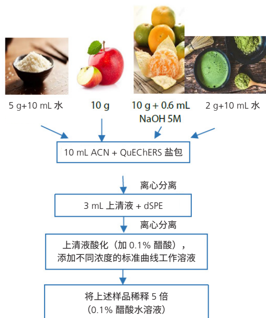
图 1 样品前处理流程