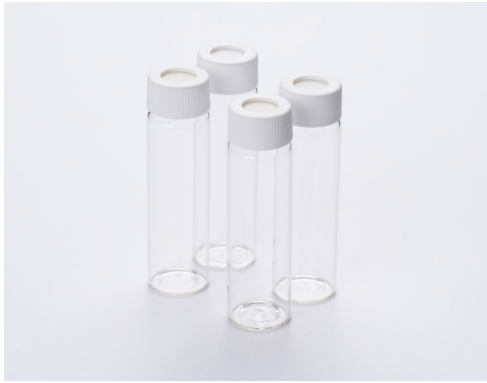
图 1 TOC 分析仪用 CQ 样品瓶（带有 QC 证书）

在采集水样时，样品很容易受到大气中的有机物、二氧化碳以及容器的污染，导致测量值可能会高于实际值，从而需要重新采样测试。因此，在处理 TOC 浓度较低的试样时，最重要的是采取措施防止样品被污染。