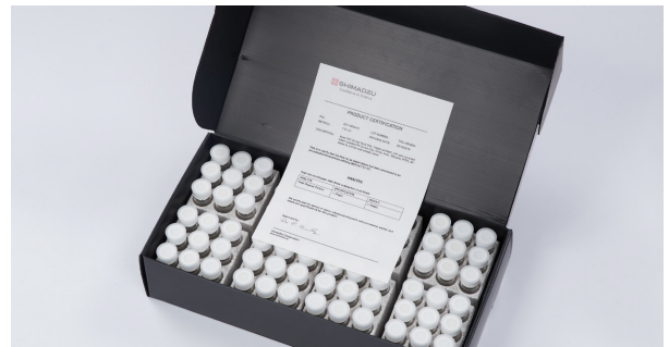
图 2 CQ 样品瓶与 QC 证书

CQ 样品瓶是按照严格的程序进行生产和预清洗。每个样品瓶安装了防尘盖，并使用无尘包装箱进行包装。产品上带有批号，并附有 QC 证书，样品瓶内 TOC 值小于 10 μg C/L（碳浓度 10 μg/L）。