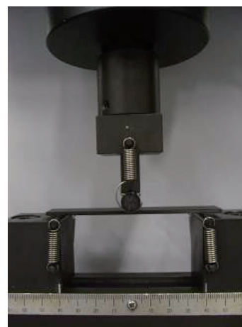
图 2. 试验实物图

对于使用标准尺寸试样进行的试验，跨度支架之间 (L) 应为 80 mm ± 0.2 mm。使用软件时，弯曲应力可以自动计算并绘制成试验图和试样尺寸。弯曲强度和其他特性也可以通过一些简单的操作获得值。