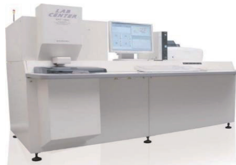
图 1 XRF-1800