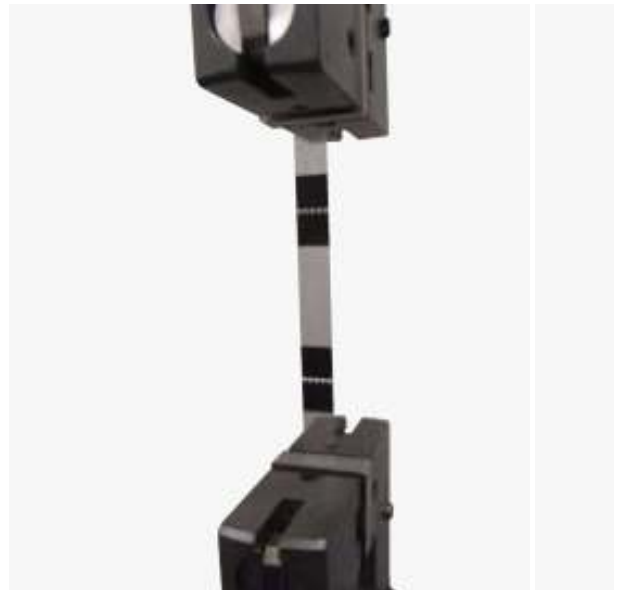
图 1 试验配件

图 1 为本次试验，使用气动平推夹具，胶面夹齿，提供稳定可靠夹持力，即不会损坏样品，又不会出现打滑。此次试验使用了岛津 TRViewX 240S 视频引伸计，它可以高精度地测量试样实时应变，通过引伸计 - 电机 - 横梁闭环控制，确保高控制精度。