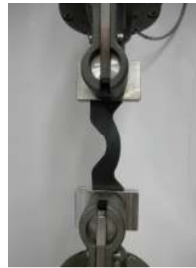
图 1 测试系统图（主机，夹具）

夹具与样品按（图 1）所示，安装在主机上，确保测试前，上下夹具分别夹住新月形试样的两端，夹齿间距离保持 60mm 距离，并卸除内应力使载荷保持在接近 0N 附近。试验时，以 500mm/min 的速率加载完成试验。