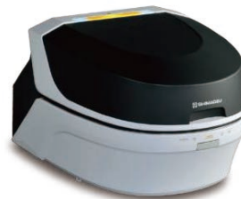
图 1 EDX-7200