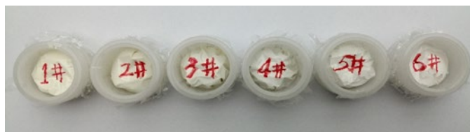
图 1 实验样品的处理

涂料实验样品为无定型的流体样品，测试时需要放置在装有迈拉膜的样品杯中，实验采用 PE 保鲜膜和迈拉膜固定放置，PE 膜经测试无重金属元素存在，样品处理见图 1。